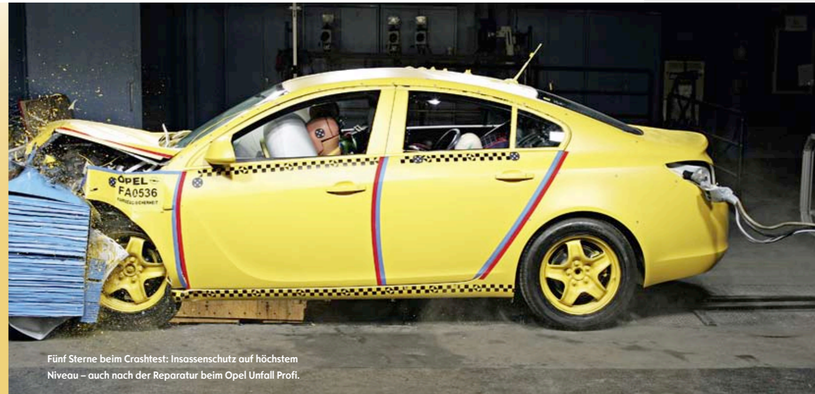
Fünf Sterne beim Crashtest: Insassenschutz auf höchstem Niveau – auch nach der Reparatur beim Opel Unfall Profi.

Fünf Sterne im Euro NCAP Crashtest stehen für perfekten Insassenschutz bei Pkws. Ein nicht fachgerecht instand gesetztes Unfallfahrzeug könnte das Crashtestergebnis jedoch auf nur noch zwei Sterne senken – mit unvorhersehbaren Folgen für die Insassen. Der Opel Unfall Profi bürgt für den Erhalt der passiven Sicherheit durch zertifizierte Reparaturen nach Herstellervorgabe. Für Flottenbetreiber bieten sich individuelle Kooperationen an